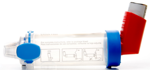
Inhalador con una cámara inhalatoria

Si no tiene una cámara inhalatoria para la escuela, comuníquese con la enfermera de la escuela para obtener más información.